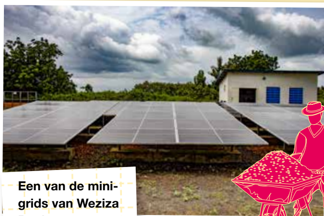
Een van de mini-grids van Weziza Benin

Tijdens dit project krijgen twee huishoudens of kleinschalige bedrijven in de geselecteerde gemeenschappen training over het gebruik van elektrische graanmolens. Elk huishouden of bedrijf zal een geïnstalleerde en operationele graanmolen gebruiken die is aangesloten op een mini-grid. Naarmate er op deze manier meer waarde wordt toegevoegd aan de lokale graantoevoerketens, zal dit de inkomens van huishoudens en bedrijven verhogen met alle voordelen van dien voor de gemeenschap.